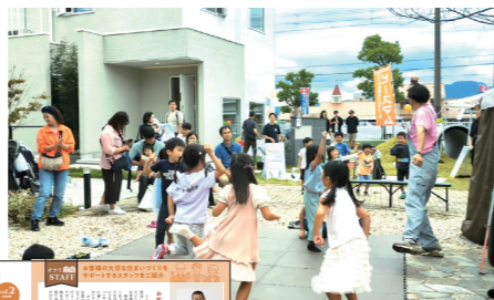
オウミDEマルシェ イベントのワンシーン