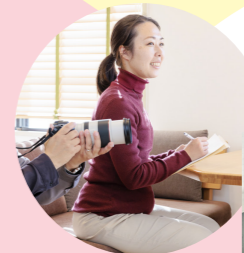
インタビューや写真撮影のディレクションをすることもあります。