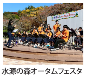
水源の森オータムフェスタ

近江富士花緑公園の「水源の森オータムフェスタ」は森林と琵琶湖の環境保全意識の向上等を目的に昨年11月に開催されました。