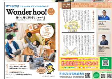
リフォームマガジン 「わんだホー！」もお手伝いさせていただきます