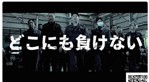
株式会社西村工作所さま 45周年記念ムービー

こちらは45周年の記念祝賀会上映するために、社員様のインタビューを通じて今の会社の雰囲気や想いを収録しました。祝賀会での上映の際には社員の皆さまに大変好評いただきました。