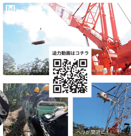
迫力動画はコチラ